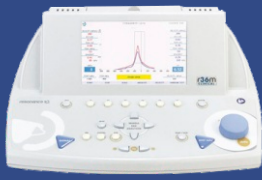
Κλινικοί Τυμπανογράφοι RESONANCE, Ιταλίας