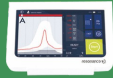
Φορητοί Τυμπανογράφοι RESONANCE, Ιταλίας