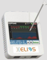
Προκλητά δυναμικά – ωτοακουστικές εκπομπές Elios ECHODIA, Γαλλίας