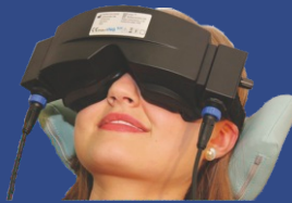
Βιντεουσταγμογράφος VNG - USB DANTSCHKE, Γερμανίας