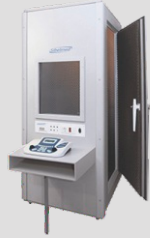
Ακοολογικοί θάλαμοι SIBELMED, Ισπανίας