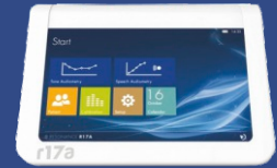
Φορητοί Ακουογράφοι RESONANCE, Ιταλίας