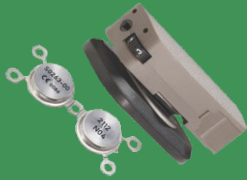
Ακουστικό βοήθημα οστέινης καθήλωσης Sorphon MEDTRONIC